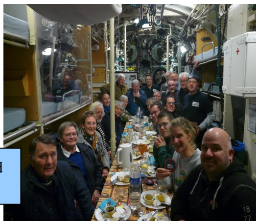
Dernier repas à bord de La Flore

Nous avons embrayé au printemps sur les repas à bord de la FLORE. Toujours autant de succès pour ces trois événements dont le dernier s'est tenu en novembre. Les 16 convives repartent toujours enchantés d'avoir participé à cette expérience peu commune en compagnie des membres du MESMAT.