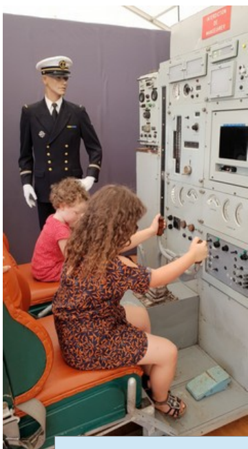
Naissance d'une vocation ?

Mi-juillet, première édition de "LORIENT OCEANS". Manifestation nautique qui retraçait la vie maritime de Lorient depuis la compagnie des Indes jusqu'à la période contemporaine. Le MESMAT a été chargé de traiter une partie de la période militaire à travers la base de Kéroman, de sa construction à sa fermeture en 1995. Malgré la canicule plusieurs milliers de visiteurs ont arpenté le port de pêche et la base de Kéroman, vaste zone où se déroulait cette manifestation qui, devant son succès, sera reconduite dans les années à venir. A cette occasion nous avons présenté pour la première fois le simulateur de conduite d'un sous-marin type AGOSTA. Il avait été récupéré à Brest il y a quelques temps. Les spécialistes du MESMAT (merci Pascal entre autres) l'ont remis en état de présentation (remplacement des lampes par des leds... etc, sonorisation des différentes commandes... et ce n'est pas fini...). Un régal pour les visiteurs très intéressés de notre stand et surtout pour les enfants heureux de manœuvrer les barres de plongée d'un sous-marin et un peu apeurés lorsque retentissait le klaxon d'alerte (ai-je fait une bêtise???).